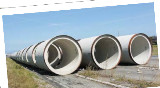
På havnen i Hundested ligger elementerne klar til transporten til Helsinge.