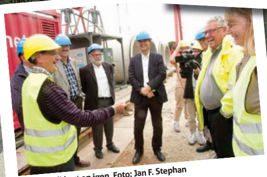
Alle kom sikkert op igen.

Har du lyst til at blive NATTERAVN i Helsinge, så kontakt os på tlf. 2712 3671